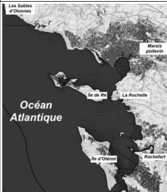
Élévation de 1 m