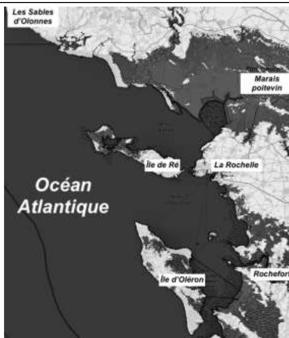
Élévation de 3 m en 2250